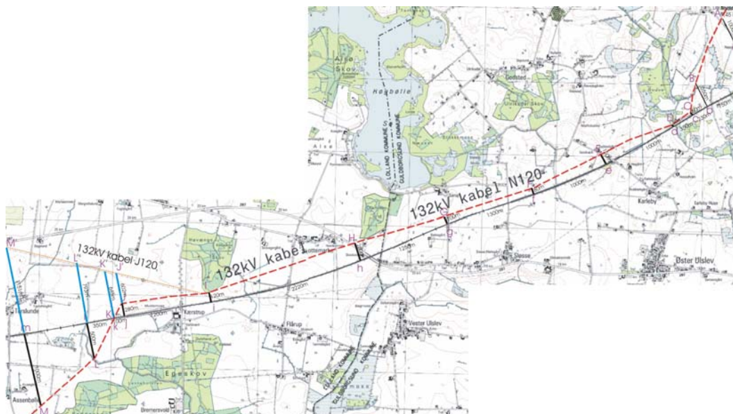
Figur 1 Nærført strækning mellem kabelanlæg og bane

Nærføringssagen er i dette tilfælde foranlediget af beslutningen om at placere den nye havmøllepark Rødsand 2, syd for Lolland, hvorved der er behov for et 132 kV kabelanlæg benævnt N120, som tilsluttes i et passende punkt (Radsted nær Sakskøbing) i det eksisterende eltransmissions-net. Kabelanlægget som er ca. 35 km langt vil på en strækning af 10,6 km have nærføring med banen Nykøbing F-Rødby (se Figur 1).